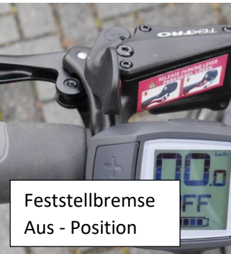
Feststellbremse Aus - Position

Vorderbremse ist rechts- kleiner Hebel zum arretieren