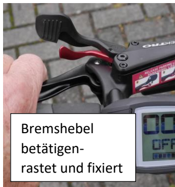
Bremshebel betätigen- rastet und fixiert