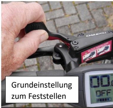
Grundeinstellung zum Feststellen