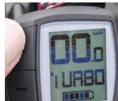
Die 4 Unterstützungsstufen durch kurzes tippen +/- wählen