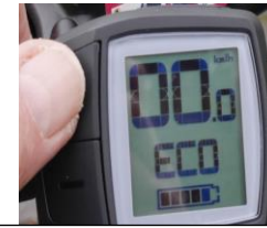
Langes tippen auf (+) schaltet Licht an/aus

Diese Kurzanleitung soll nur als Ergänzung zur vollumfänglichen Bedienungsanleitung genutzt werden- bei Verwendung der angegebenen Informationen geschieht dies auf eigenes Risiko.