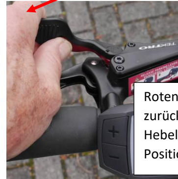
Roten Hebel zurück und beide Hebel in Aus - Position